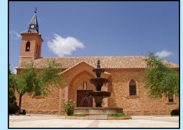
Iglesia de Santa Catalina